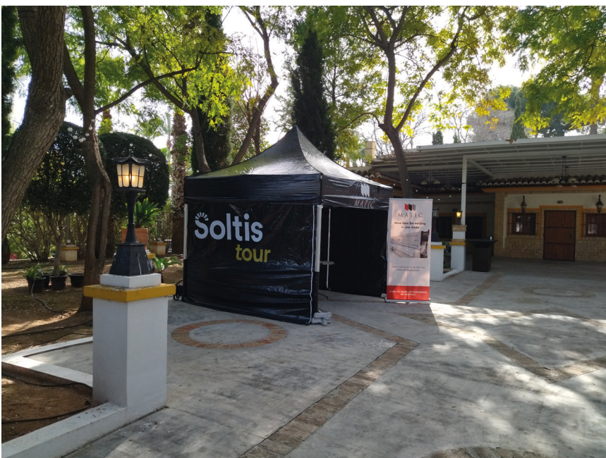
El Soltis Tour de Serge Ferrari, en el que colabora Matic, recorrerá durante doce semanas, treinta ciudades de siete países europeos, entre ellos España.