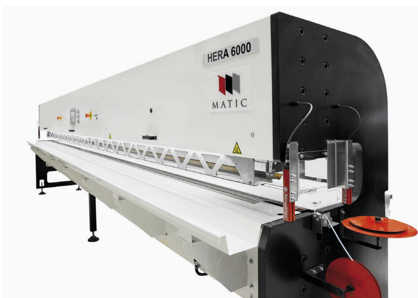
Máquina de soldado Hera 6000, de Matic.