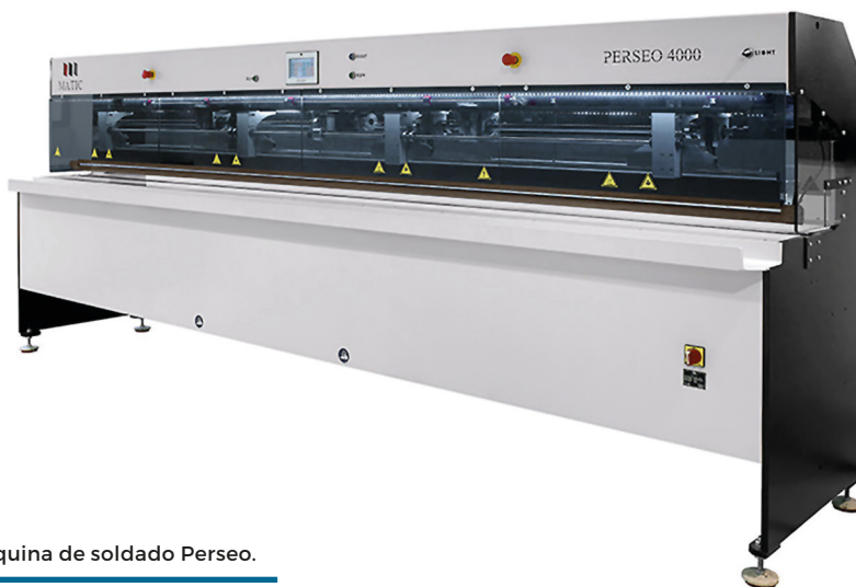
Máquina de soldado Perseo.

El Soltis Tour viajará durante 12 semanas por 30 ciudades de 7 países europeos: Francia, España, Italia, Suiza, Alemania, Bélgica y los Países Bajos. En cada parada, el camión showroom (de exposición de productos e innovaciones de Soltis) está acompañado por los stands de los socios permanentes del tour: Somfy, Matic, Lafuma mobilier, Giofex y Serge Ferrari Premium Partner. ■